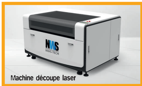
Machine découpe laser