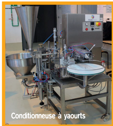
Conditionneuse à yaourts